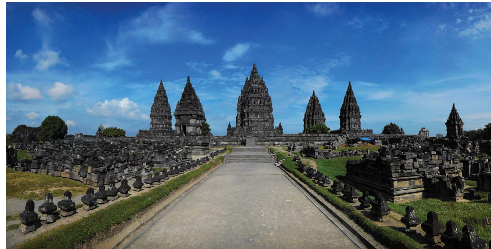
Gambar 2.1 Kompleks Candi Prambanan

Bangsa Indonesia merupakan bangsa yang religius. Bukti-bukti ketakwaan kepada Tuhan Yang Maha Esa sudah sejak lama menjadi tradisi bangsa Indonesia. Berbagai aliran kepercayaan terhadap Tuhan Yang Maha Esa dan agama tumbuh dan berkembang di wilayah Indonesia. Tradisi keagamaan dan artefak peninggalan masa lalu cukup banyak untuk menunjukkan bukti bangsa Indonesia sebagai bangsa religius.