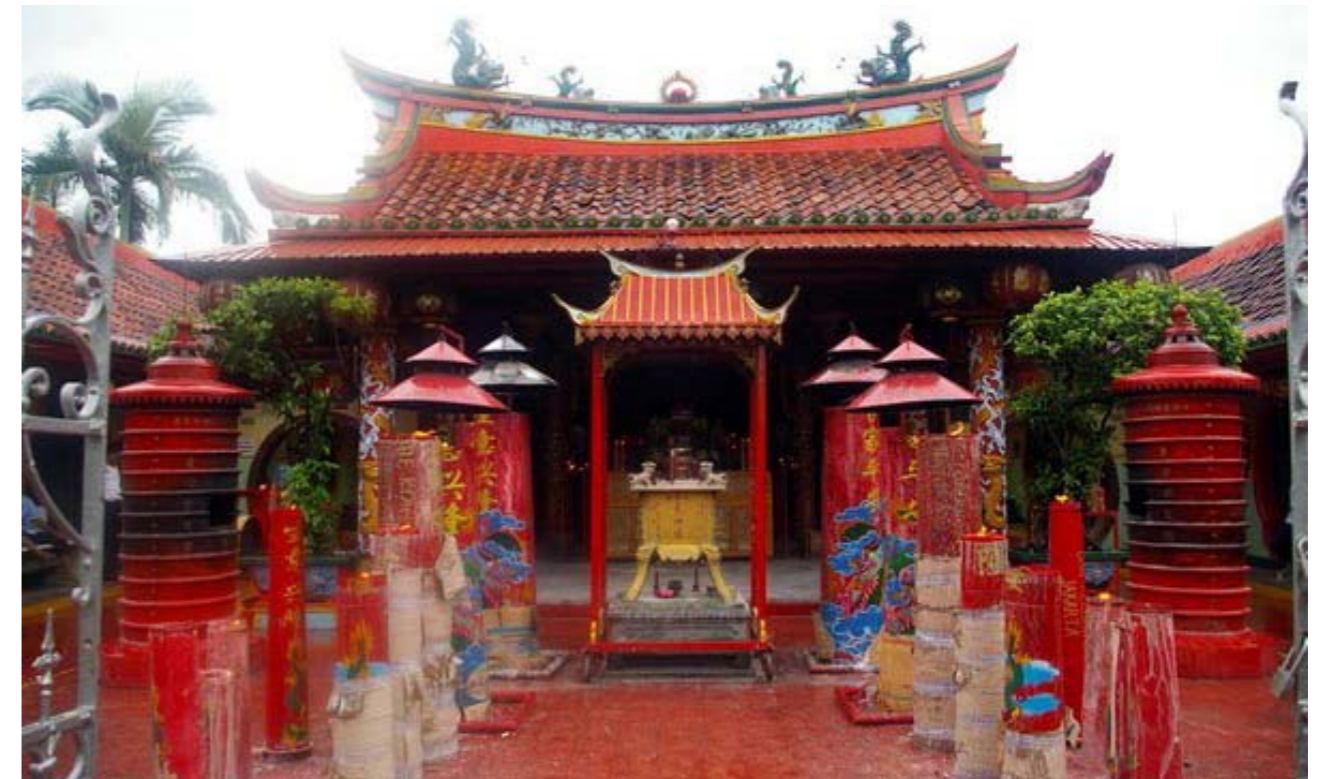
Gambar 2.6 Klenteng Boen Tek Bio - Pasar Lama Tangerang

Bukti ketakwaan bangsa Indonesia yang menganut Agama Konghucu adalah terdapatnya tempat-tempat ibadah Konghucu yang disebut Klenteng, Litang, dan Miao. Dalam laman http://www.meandconfucius.com/2010/12/tempat-ibadah-agama-khonghucu.html diuraikan, bahwa Litang adalah nama tempat ibadah agama Konghucu yang banyak terdapat di Indonesia. Saat ini sudah ada lebih dari 150 Litang yang tersebar di seluruh Indonesia yang berada di bawah naungan MAKIN (Majelis Agama Konghucu Indonesia) dan organisasi pusatnya adalah MATAKIN (Majelis Tinggi Agama Konghucu Indonesia). Ciri tempat ibadah tersebut selain altarnya yang berisi Kim Sin, Nabi Kongzi/Konghucu, juga biasanya terdapat lambang «Mu Duo» atau Bok Tok (dalam dialek Hokian) yaitu berupa gambar Genta dengan tulisan huruf 'Zhong Shu' atau Tiong Sie (bahasa Hokian) artinya «Satya dan Tepasarira/Tenggang Rasa» yang merupakan inti ajaran agama Konghucu. Hal ini sesuai dengan Sabda Nabi Kongzi dalam Kitab Lun Yu: «Apa yang diri sendiri tiada inginkan, janganlah diberikan terhadap orang lain».