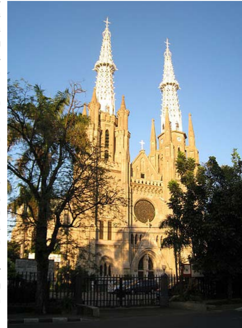
Gambar 2.4 Gereja Katedral Jakarta, salah satu tempat umat Katolik beribadah

Salah satu bukti masuknya Agama Kristen Katolik (Agama Katolik) adalah Gereja Katedral Jakarta. Dalam http://kasihkekal.blogspot.co.id/2012/10/gereja-gereja-bersejarah-di-indonesia_24.html . dijelaskan, bahwa Gereja Katedral Jakarta nama resminya adalah Santa Maria Pelindung Diangkat Ke Surga atau De Kerk van Onze Lieve Vrouwe ten Hemelopneming. Gedung gereja ini diresmikan pada 1901 dan dibangun dengan arsitektur neo-gotik dari Eropa, yakni arsitektur yang sangat lazim digunakan untuk membangun gedung gereja beberapa abad yang lalu. Gereja yang sekarang ini dirancang dan