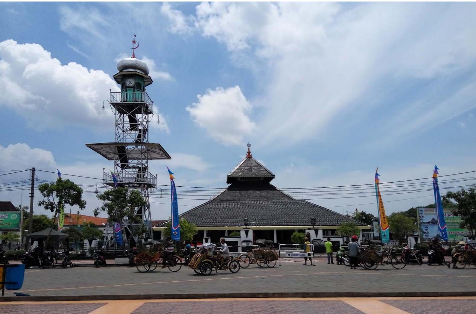
Gambar 2.3 Masjid Agung Demak

Kebesaran agama Islam antara lain dibuktikan oleh kemegahan Masjid Agung Demak. Tempat berdirinya Masjid Agung Demak dahulunya bernama tlatah (wilayah) Glagahwangi. Daerah Glagahwangi yang merupakan kawasan rawa (payau) ini pertama kali dibuka oleh Raden Patah, putra Prabu Kertabumi atau Brawijaya V dengan putri Campa (Kamboja) yang telah masuk Islam. Raden Patah yang masa kecilnya dihabiskan di Pesantren Ampel Denta, Surabaya, yang dikelola Sunan Ampel inilah yang kelak mendirikan Kesultanan Demak.