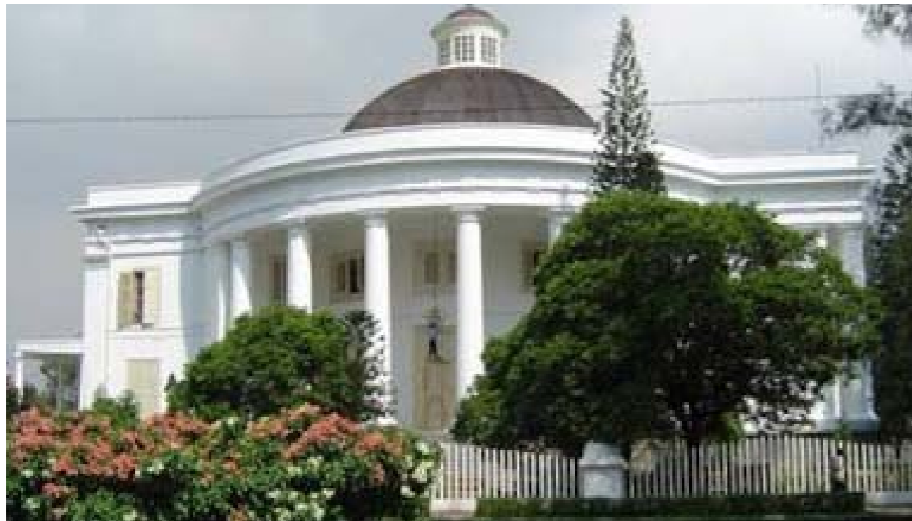
Gambar 2.5 Gereja Immanuel Jakarta adalah bukti adanya pemeluk Agama Kristen di Indonesia

Gereja Immanuel Jakarta adalah bukti adanya pemeluk Agama Kristen Protestan (Agama Kristen) di Indonesia. Penjelasan secara rinci terdapat dalam http://kasihkekal.blogspot.co.id/2012/10/gereja-gereja-bersejarah-di-indonesia_24.html . Gereja Immanuel awalnya adalah gereja yang dibangun atas dasar kesepakatan antara umat Reformasi dan Umat Lutheran di Batavia. Pembangunannya dimulai tahun 1834 dengan mengikuti hasil rancangan J.H. Horst. Pada 24 Agustus 1835, batu pertama diletakkan. Empat tahun kemudian, 24 Agustus 1839, pembangunan berhasil diselesaikan. Bersamaan dengan itu gedung ini diresmikan menjadi gereja untuk menghormati Raja Willem I, raja Belanda pada periode 1813-1840. Pada gedung gereja dicantumkan nama Willemskerk. Gereja bergaya klasisisme itu bercorak bundar di atas fondasi tiga meter. Bagian depan menghadap Stasiun Gambir. Di bagian ini terlihat jelas serambi persegi empat dengan pilar-pilar paladian yang menopang balok mendatar. Paladinisme adalah gaya klasisisme abad ke-18 di Inggris yang menekan simetri dan perbandingan harmonis. Orgel yang dipakai berangka tahun 1843, hasil buatan J. Datz di negeri Belanda. Sebelum organ terpasang, sebuah band tampil sebagai pengiring perayaan ibadah. Pada 1985, orgel ini dibongkar dan dibersihkan sehingga sampai kini dapat berfungsi dengan baik. Sekarang Gereja Immanuel bernama resmi Gereja Protestan di Indonesia bagian Barat (GPIB) Jemaat Immanuel Jakarta.