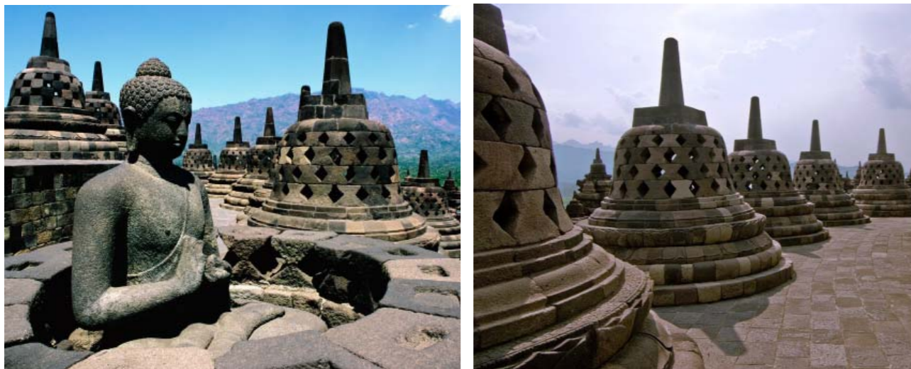
Gambar 2.2 Candi Borobudur ditandai dengan banyaknya stupa dan patung Budha

Kebesaran bangsa Indonesia sebagai bangsa yang meyakini adanya Tuhan Yang Maha Esa dibuktikan juga dengan adanya Candi Barabudhur. Dalam penjelasan di laman tentang candi http://candi.perpusnas.go.id/temples/deskripsi-jawa_tengah-candi_barabudhur dinyatakan, bahwa sampai saat ini belum ada kesepakatan di antara para pakar tentang nama Barabudhur. Dalam Kitab Negarakertagama (1365 M.) disebut-sebut tentang Budur, sebuah bangunan suci Buddha aliran Vajradhara. Menurut Casparis dalam Prasasti Sri Kahulunan (842 M) dinyatakan